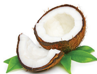
cocco nutre il pelo