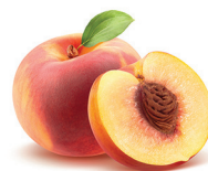
pesca lenisce la cute